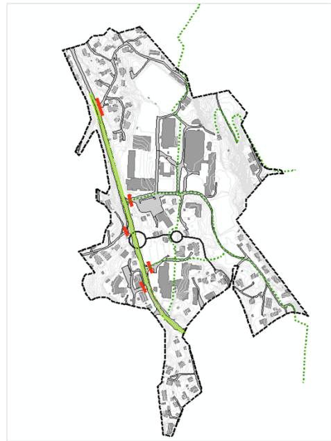
Figur 2: Prinsipppløsnings for veg og trafikk

Barn og unges interesser er høyt prioritert i planarbeidet. Det er nødvendig å se interessene og mulighetene i et langsiktig perspektiv, og vurdere hvilke muligheter de ulike alternative løsningene av området gir.